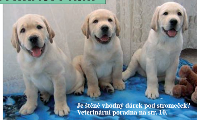
Je štěně vhodný dárek pod stromeček? Veterinární poradna na str. 10.

provedli prozatímní ošetření končetiny. Po úplné stabilizaci jsme přikročili k operaci, při které jsme museli amputovat celou hrudní končetinu a odstranit mrtvou tkáň na boku. Bad se po operaci rych-