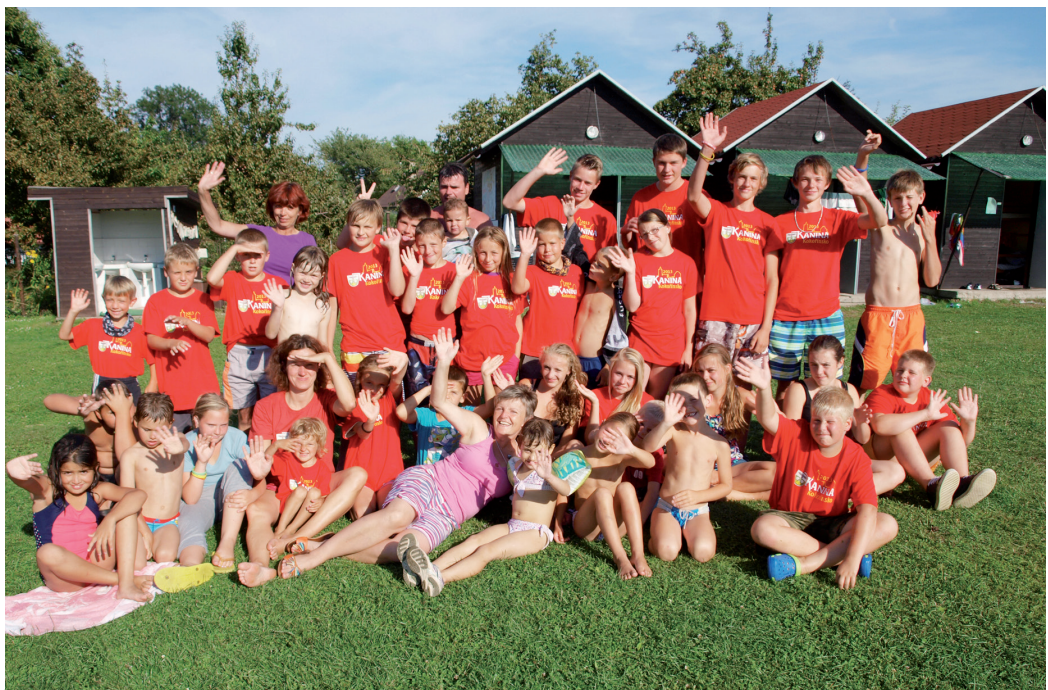
●●● HLAVENEČTÍ SE VĚNUJÍ DĚTEM A MLÁDEŽI. Zdejší dlouholetou zvyklostí je i pořádání letních táborů, které se konají pokaždé na jiném místě v ČR. Letos tomu nebude jinak.