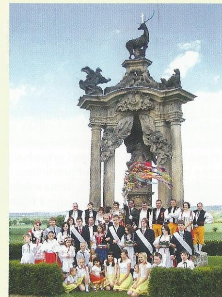
Staročeské máje v Hlavenci