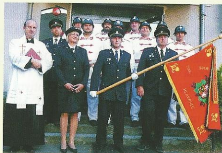
Oslava 120. výročí SDH