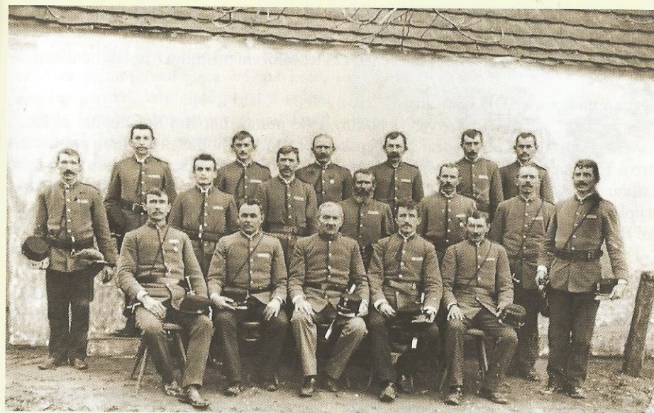
Hlavenec – zakládající členové SDH v r. 1889

V roce 1979 bylo znovu založeno družstvo žen (duben 1927 – založení tzv. ženského a žákovského odboru Hasičského sboru v Hlavenci). Velkým přínosem bylo v roce 2008 vybudování vlastního hasičského cvičiště s příručním skladem ve spodní části obce. Nejvýznamnější akcí hasičského roku 2009 byla oslava 120. výročí založení SDH Hlavenec, jejíž nedílnou součástí byla výstava o historii SDH Hlavenec. 18. 9. posvětil farář A. Griegel z farnosti Benátky nad Jizerou hasičský prapor a historickou stříkačku Márovku (vy-